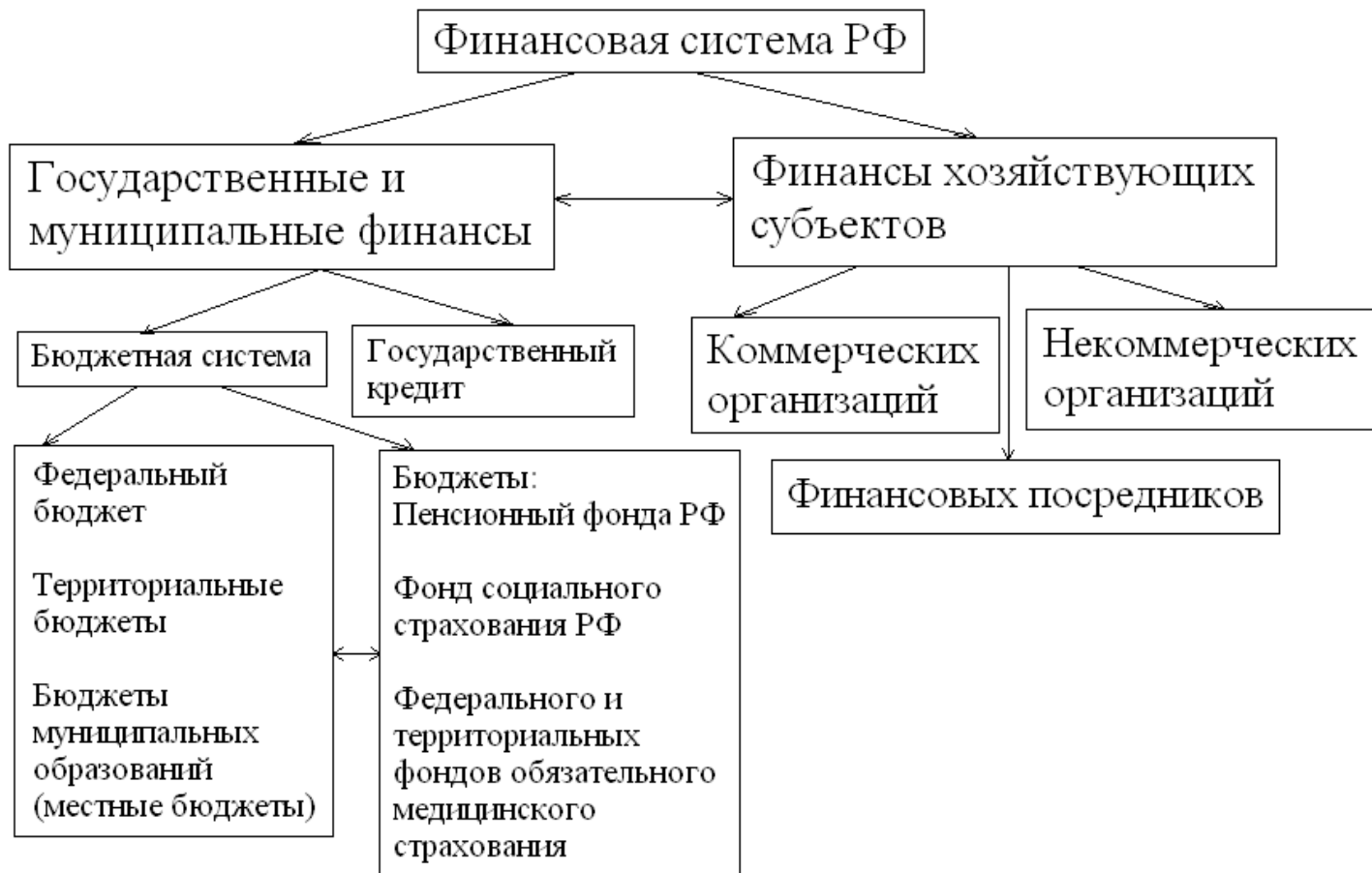
Рис. 2.2. Звенья финансовой системы РФ.

На данном рисунке видно, что бюджетная система является главным звеном финансовой системы Российской Федерации. Это означает, что бюджетная система оказывает большое влияние на всю экономику страны в целом. Успех экономических преобразований зависит от направлений развития бюджетной системы.