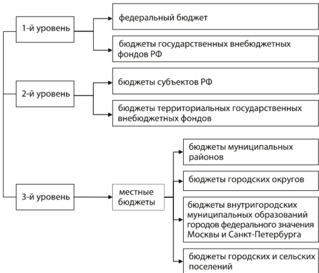
Рис. 2.3. Структура бюджетной системы РФ.

Совокупность бюджетов всех уровней образует консолидированный бюджет. Консолидированный бюджет определяется Бюджетным кодексом как свод бюджетов всех уровней на соответствующей территории.